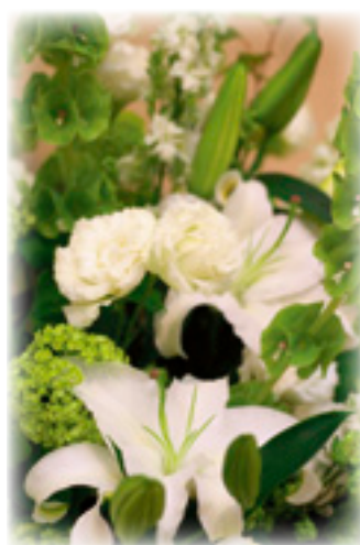
寄稿：収納記事 ＜パッチワーク通信No. 172 (2. 2013) に掲載＞