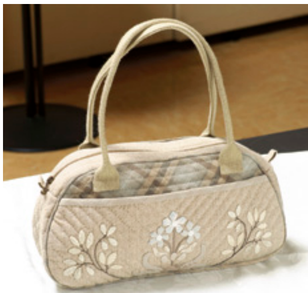
ポストン型バッグ