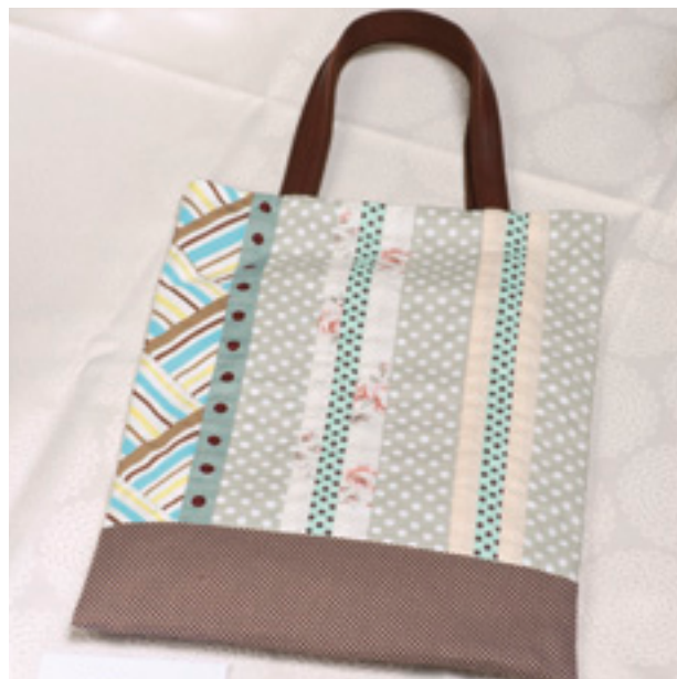
ストリングのシンプルバッグ ＜クロバー手づくりブックシリーズに掲載＞