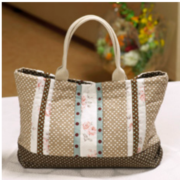
ストリングのトートバッグ ＜クロバー手づくりブックシリーズに掲載＞