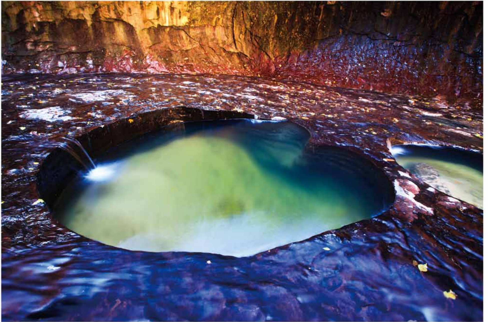
“秘境”と呼ぶにふさわしい神秘的な洞窟だ。中に入っていくと、ここに至るまでの探検の疲れも一気に吹き飛んでしまった。