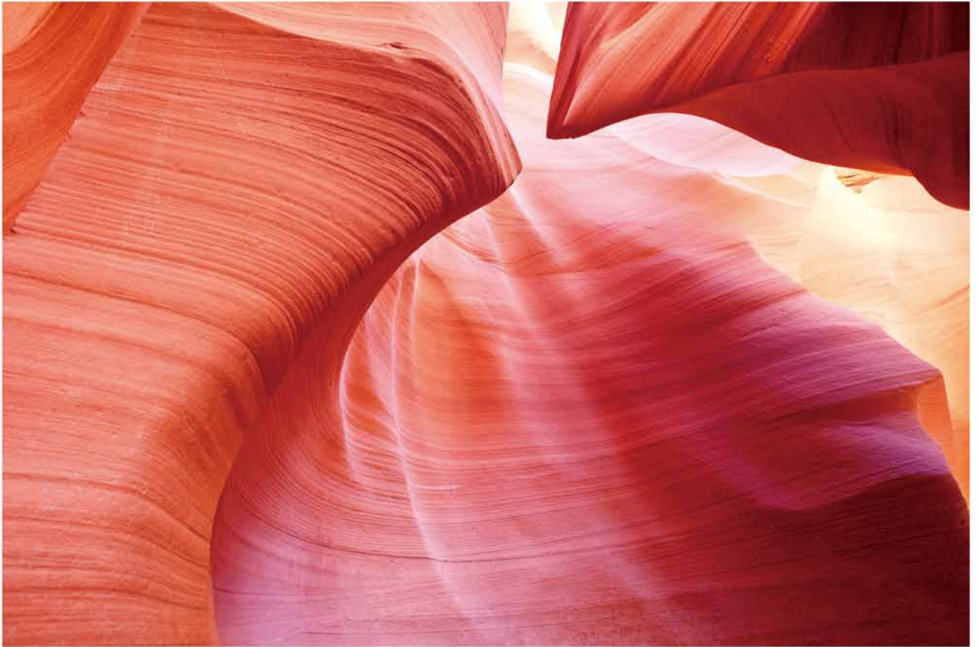
ドレープカーテンのような岩肌の洞窟はナバホ族の聖堂だ。光が織りなすたおやかなグラデーションに、時を忘れて心奪われる。